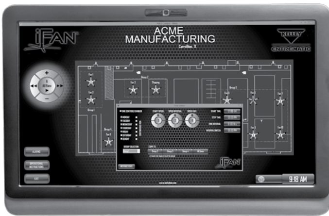
Cuadro de diálogo de configuración del temporizador para la dirección y velocidad de un ventilador HVLS individual o zonas de ventiladores para configurarse según la hora del día.