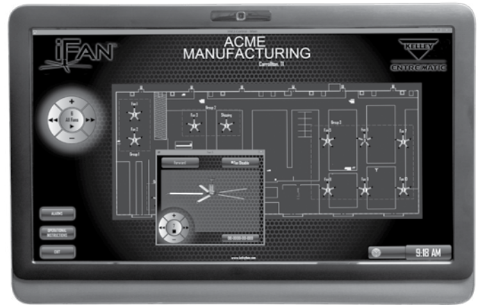
Cuadro de diálogo para ventilador individual con acceso a opciones de dirección y velocidad para un ventilador específico.